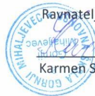
Karmen Sklepić, mag.prim.educ.